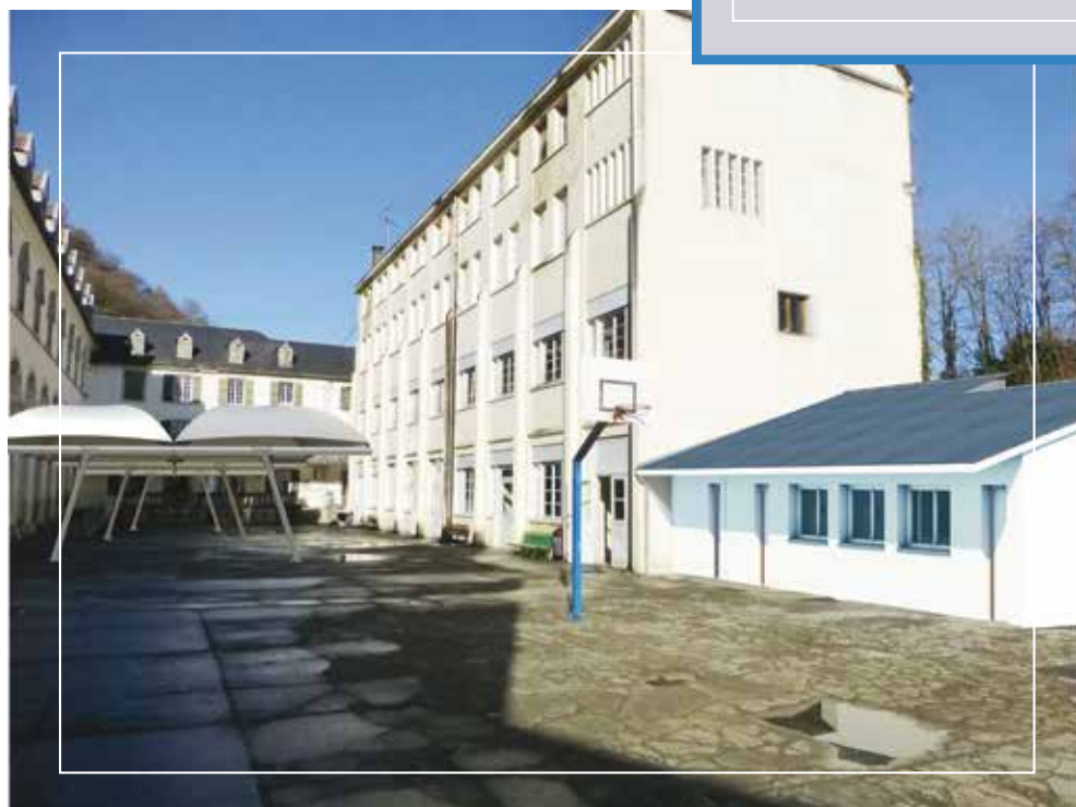
Cour intérieure sur Lestelle

Cette réorganisation des lycées et l'arrêt de l'utilisation du bâtiment lycée sur Lestelle , demandent la création au collège d'un laboratoire de sciences dans la cour.