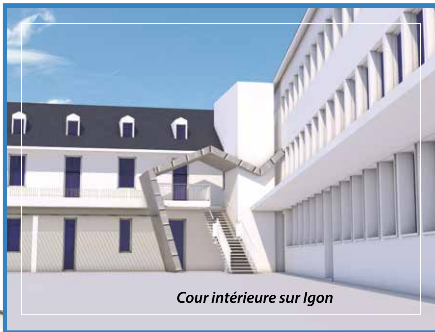
Cour intérieure sur Igon

Six classes seront aménagées dans la partie des anciens dortoirs, ainsi qu'un laboratoire de sciences au 1er et 2ème étage du bâtiment.