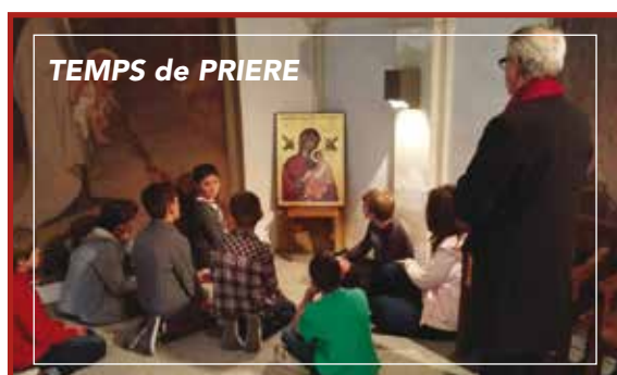
TEMPS de PRIERE

Lors de la semaine Sainte, nous organiserons un chemin de croix sur les hauteurs des sanctuaires de Bétharram pour les collégiens et les lycéens. Durant cette semaine, des temps de prière et de partage pour les jeunes et les adultes seront célébrés les matins.