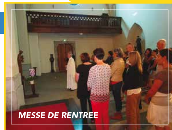
MESSE DE RENTREE

Il est le reflet des engagements de notre année.