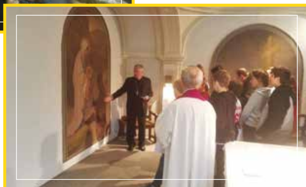
Visite Pastorale de Monseigneur Aillet