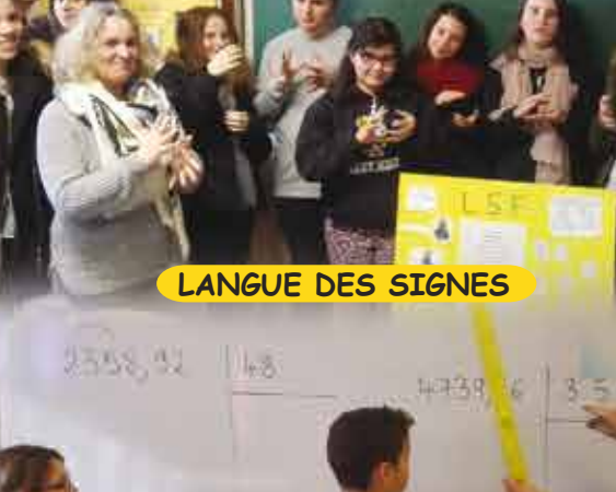
LANGUE DES SIGNES