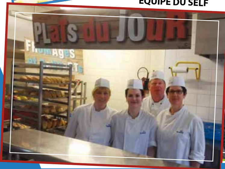
EQUIPE DU SELF