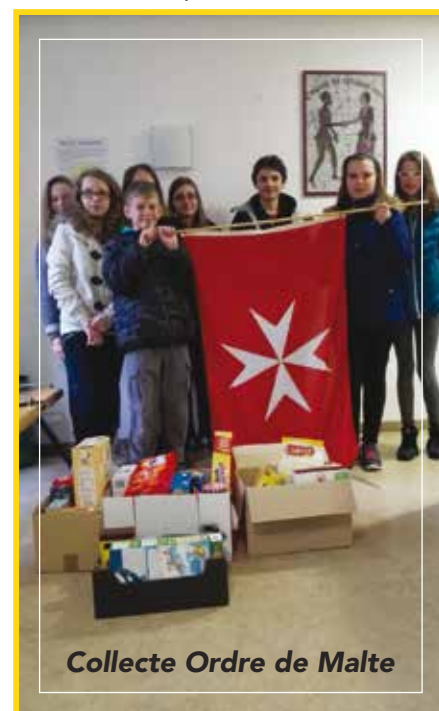
Collecte Ordre de Malte