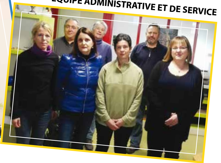
EQUIPE ADMINISTRATIVE ET DE SERVICE