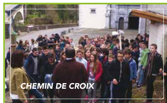
CHEMIN DE CROIX